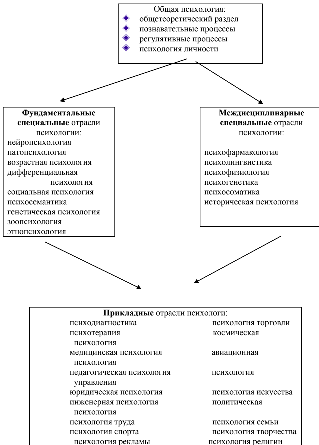
схема. 1.1. Отрасли психологии