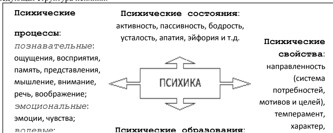
Рис. 2.1. Структура психики в отечественной психологии

Для более адекватного и полного представления структурных элементов, составляющих психику личности, необходимы знания этой структуры. В отечественной психологии принята следующая структура психики.