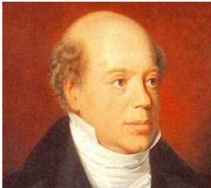
Натан Майер Ротшильд (1777—1836)

Информационное общество - это общество, в котором большинство работающих занято производством, хранением, переработкой и реализацией информации, особенно высшей её формы — знаний. Материальное производство и производство энергии возлагается на машины.