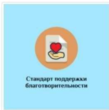
Стандарт поддержки благотворительности