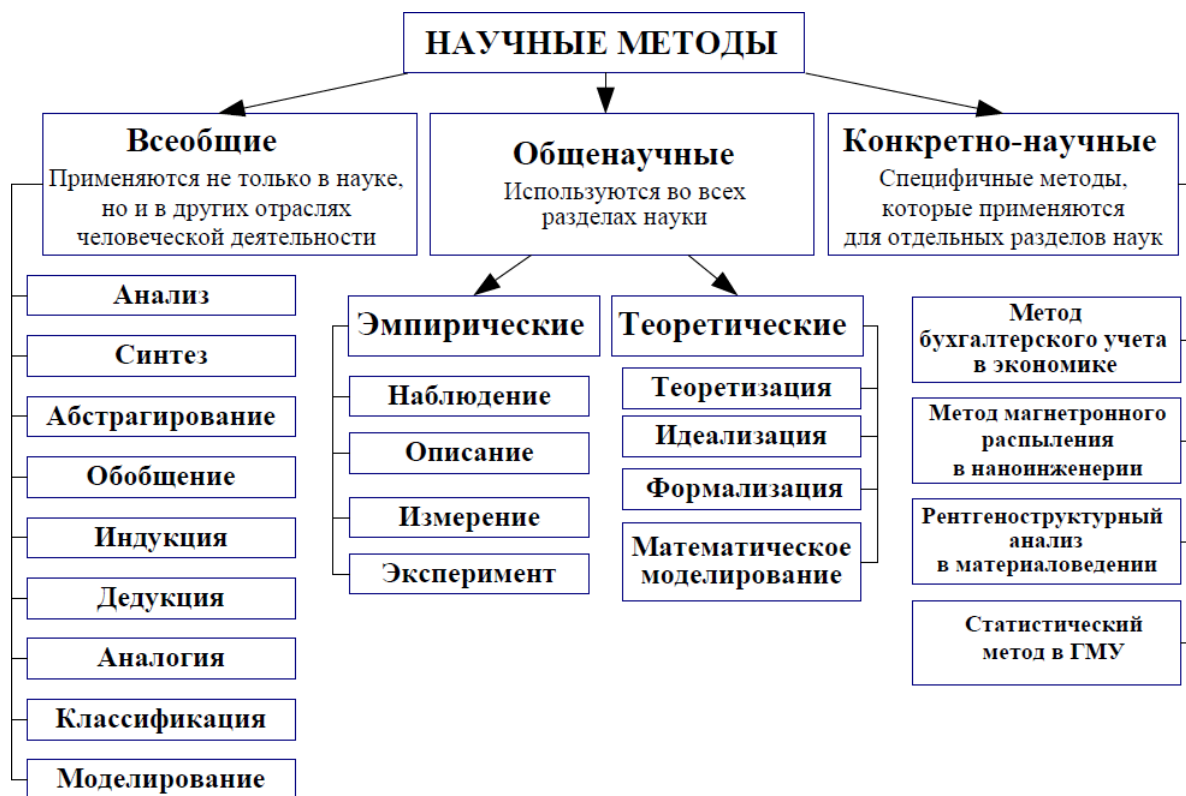
Рис. 1. Классификация методов

Частные методологии применяются только в одной конкретной науке, например, медицинская методология ориентирована на познавательную деятельность в медицине.