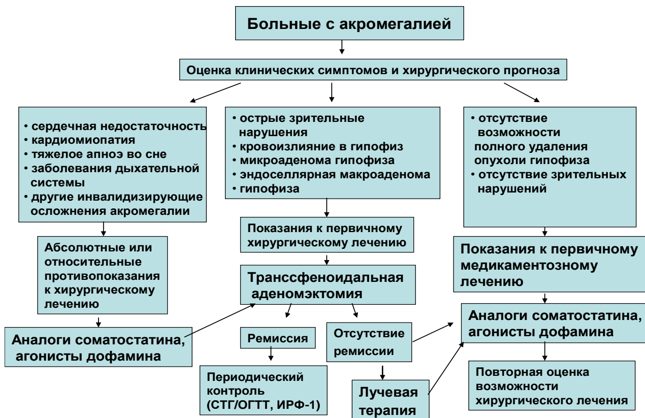
Рис. 6 Алгоритм лечения акромегалии