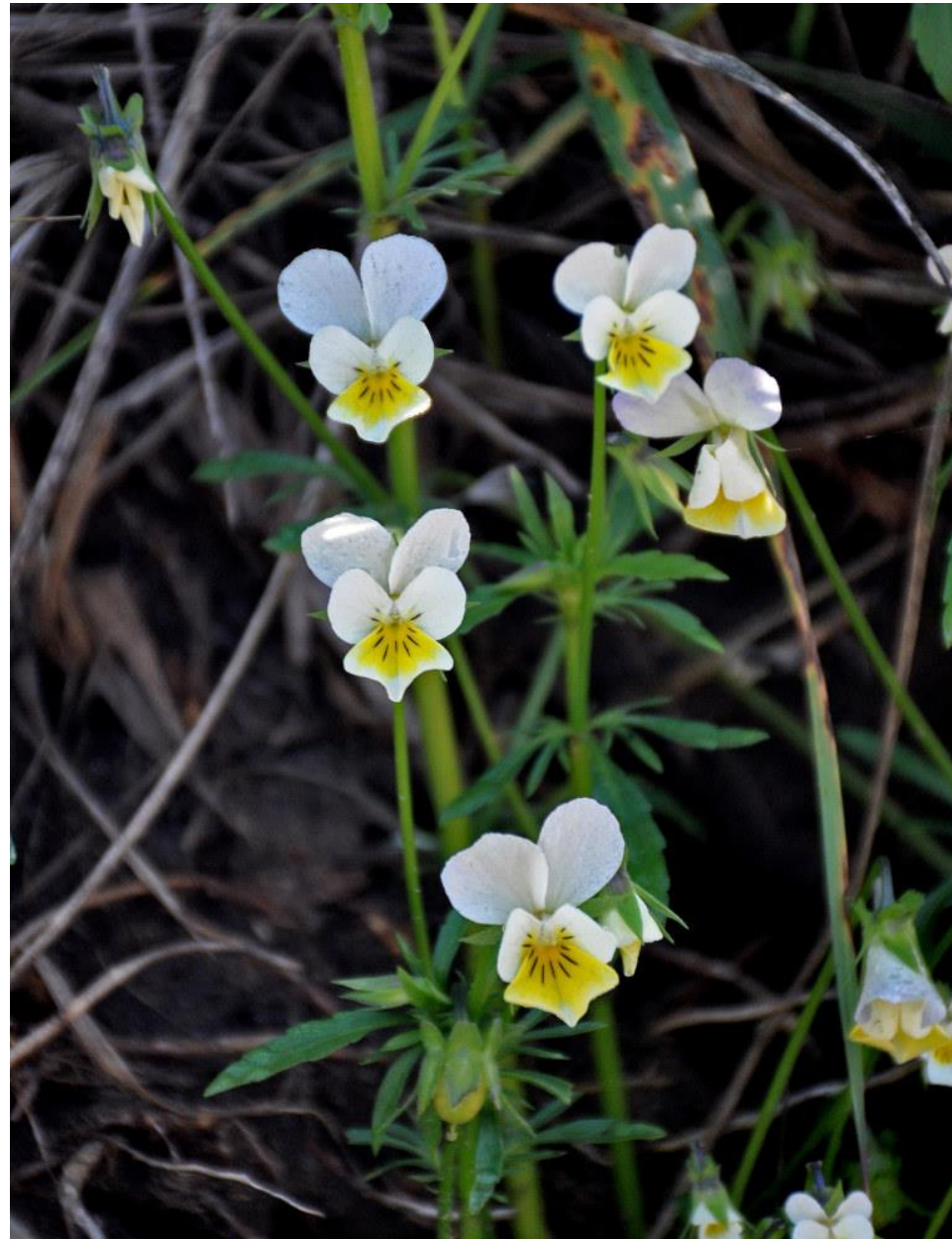
Фиалка полевая - Viola arvensis Murray