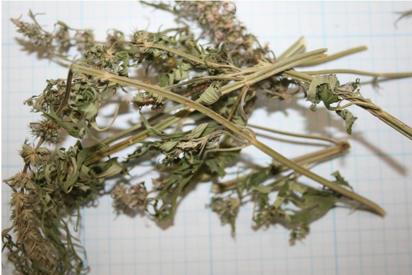
Пустырника трава – Leonuri herba