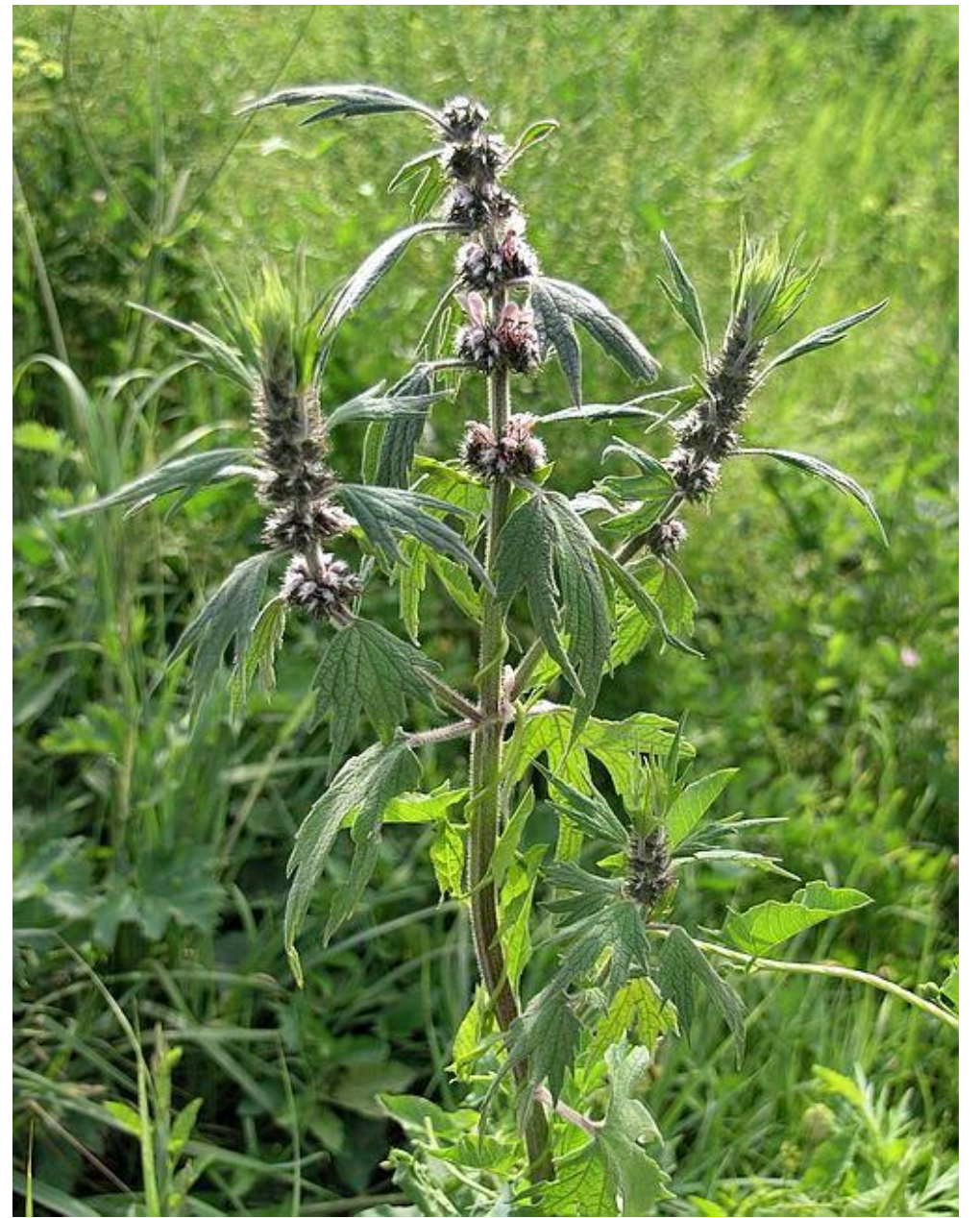
Пустырник пятилопастный - Leonurus quinquelobatus Gilib.